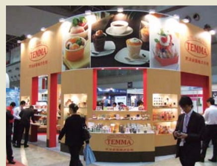
国内外の各種展示会に積極出展。 Active participation in exhibitions in Japan and abroad.